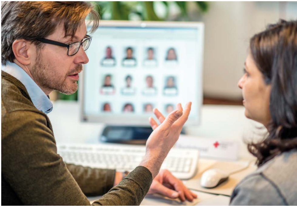
Beratung des DRK-Suchdienstes am Standort Hamburg (2015)

Vertragsstaaten der Genfer Abkommen und die Komponenten der Rotkreuz- und Rothalbmond-Bewegung haben ihr gegenseitiges Verhältnis in einer im Jahr 2007 von der Internationalen Konferenz verabschiedeten Resolution als eine spezifische und eigene Partnerschaft („specific and distinctive partnership“) definiert. 18 Diese Partnerschaft ist durch gegenseitige Verantwortung und Unterstützung gekennzeichnet. Nationale Gesellschaften haben danach u. a. die Pflicht, Anfragen der