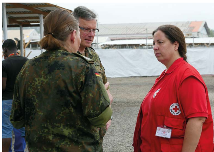
DRK-Mitarbeiterin und Angehörige der Bundeswehr in einem Ebola-Behandlungszentrum in Monrovia, Liberia (Februar 2015)

darf), entspricht eine solche Datenerhebung und -verarbeitung nicht dem Zweck des DRK-Suchdienstes. Dieser hat allein die Sammlung und Verarbeitung von Daten von Betroffenen und Suchenden zur Klärung der Unwissenheit über den Verbleib nahestehender Personen aus humanitären Gründen sowie die Wiederherstellung von Kontakt zwischen diesen Personen zum Ziel. Das DRK muss daher stets dafür Sorge tragen, dass bei seiner Beteiligung in Personenauskunftsstellen unter der Leitung einer Behörde die vom DRK erfassten Daten ausschließlich zu Suchdienst-Zwecken erhoben und verwendet werden. Auch die mögliche Nutzung gemeinsamer Räumlichkeiten, Telefonnummern oder IT-Infrastruktur kann dazu führen, dass die Unabhängigkeit des DRK in Frage gestellt wird. Das DRK-Präsidium nahm daher im April 2015 entsprechende „Leitlinien für die Zusammenarbeit des DRK mit Behörden, insbesondere der Polizei im Personenauskunftswesen nach Landesrecht“ an. Diese sehen u. a. vor, dass die Personenauskunft des DRK ausschließlich zu humanitären Zwecken erfolgen darf, die Unabhängigkeit des