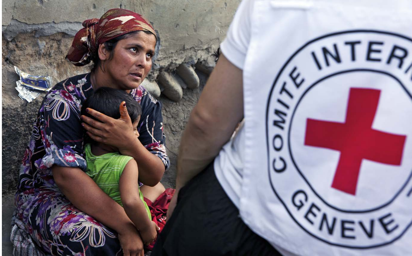
IKRK-Mitarbeiter in Kirgisistan an der Grenze zu Usbekistan (Juni 2010)