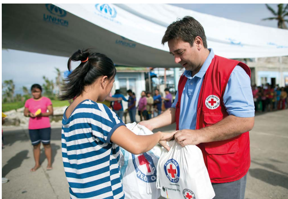
Verteilung von Hilfsgütern in Dulag, Philippinen nach dem Taifun Haiyan (Januar 2014)

Nationale Gesellschaften leisten gemäß ihres nationalen Kontextes und ihrer eigenen Ressourcen unterschiedliche Formen der Unterstützung. Diese umfassen