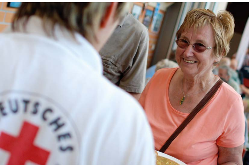
Essensausgabe in einer Sporthalle während des Elbe-Hochwassers (Juni 2013)

Eine weitere Ausprägung des Grundsatzes der Einheit ist das deutschlandweite, interdisziplinäre Zusammenarbeiten im DRK. Zu nennen ist hier insbesondere das sog. „Komplexe Hilfeleistungssystem“ (KHS). Hierbei handelt es sich um ein strategisches Konzept, das von DRK-Präsidium und DRK-Präsidialrat 2005/2006 verbindlich verabschiedet wurde. Kerngedanke ist, die vielseitigen Aufgabenfelder des DRK so miteinander zu verbinden, dass sie für die Bewältigung von Katastrophen aller Art unter einer einheitlichen Führungssystematik nutzbar sind. So kann zum einen den neuen Herausforderungen in der zivilen Sicherheitsvorsorge und der heute deutlich komplexeren Ereignisbewältigung begegnet werden. Dies gilt insbesondere auch vor dem Hintergrund des demografischen Wandels, d. h. mehr alte Menschen, die mehr Unterstützung benötigen, bei weniger einsatzbereiten Kräften. Zum anderen kann das DRK so statt einer nur punktuellen Hilfsstruktur bei Schadenslagen darüber hinaus auch eine dauerhafte Struktur mit umfassenden sozialen und gesundheitsbezogenen Angeboten, die vor und nach der Schadenslage greifen, bieten. Konkret bedeutet dies, dass beispielsweise bei Großschadenslagen nicht nur die Gemeinschaften der Bereitschaften, Berg- und Wasserwacht angesprochen sind, sondern auch das Jugendrotkreuz sowie die Wohlfahrts- und Sozialarbeit und zwar sowohl mit ihrer ehrenamtlichen Gemeinschaft als auch mit ihren über-