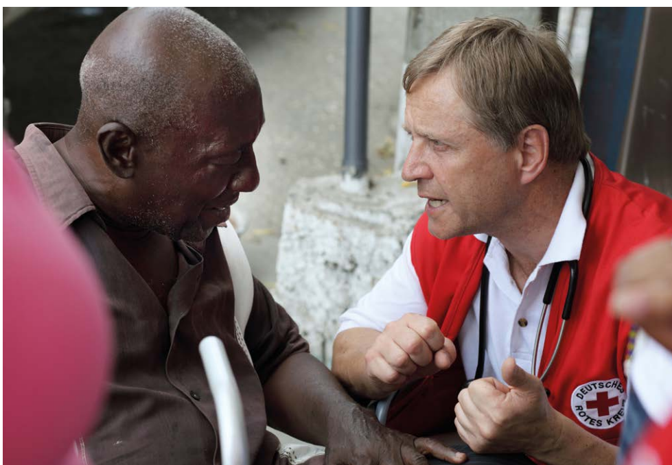
Mobiles medizinisches Team des DRK in Port-au-Prince, Haiti (Februar 2010)

Dem Schutz menschlicher Gesundheit als Teil der Mission der Internationalen Rotkreuz- und Rothalbmond-Bewegung liegt das Verständnis von Gesundheit als ein Zustand des vollständigen körperlichen, geistigen