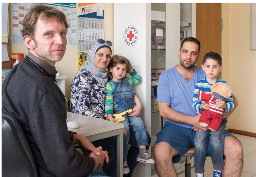
Erstaufnahme für Asylsuchende des DRK-KV Hamburg-Harburg: Geflüchtete beim Arztbesuch (Juni 2015)

Die Internationale Rotkreuz- und Rothalbmond-Bewegung setzt sich im Rahmen ihres Mandates für alle hilfebedürftigen Menschen ein und wirkt Diskriminierung entgegen. Die Liste der nach dem Grundsatz der Unparteilichkeit untersagten Unterscheidungskriterien – d. h. Nationalität, Rasse, Religion, soziale Stellung und politische Überzeugung – ist dabei nicht abschließend. Über die benannten Kriterien hinaus, die häufig Grundlage unzulässiger Diskriminierung sind, ist auch eine Unterscheidung nach sonstigen relevanten Merkmalen, beispielsweise nach Geschlecht, sexueller Orientierung oder gesellschaftlichem Status, unzulässig. 7 Die Verwendung des „Rasse-Begriffes“ wird im DRK teilweise als diskriminierend angesehen und u. a. mit Blick auf die deutsche Geschichte als unangemessen kritisiert. Daher macht das DRK mitunter von der Möglichkeit Gebrauch, auf die Bedenken hinsichtlich der Verwendung dieses Begriffes hinzuweisen und zu erläutern, dass dieser im DRK im Sinne von „Ethnie“ oder „ethnischer Herkunft“ verstanden wird. Eine einseitige sprachliche Veränderung des Grundsatzes durch das DRK ist nicht möglich, da dieser verbindlich durch die Internationale