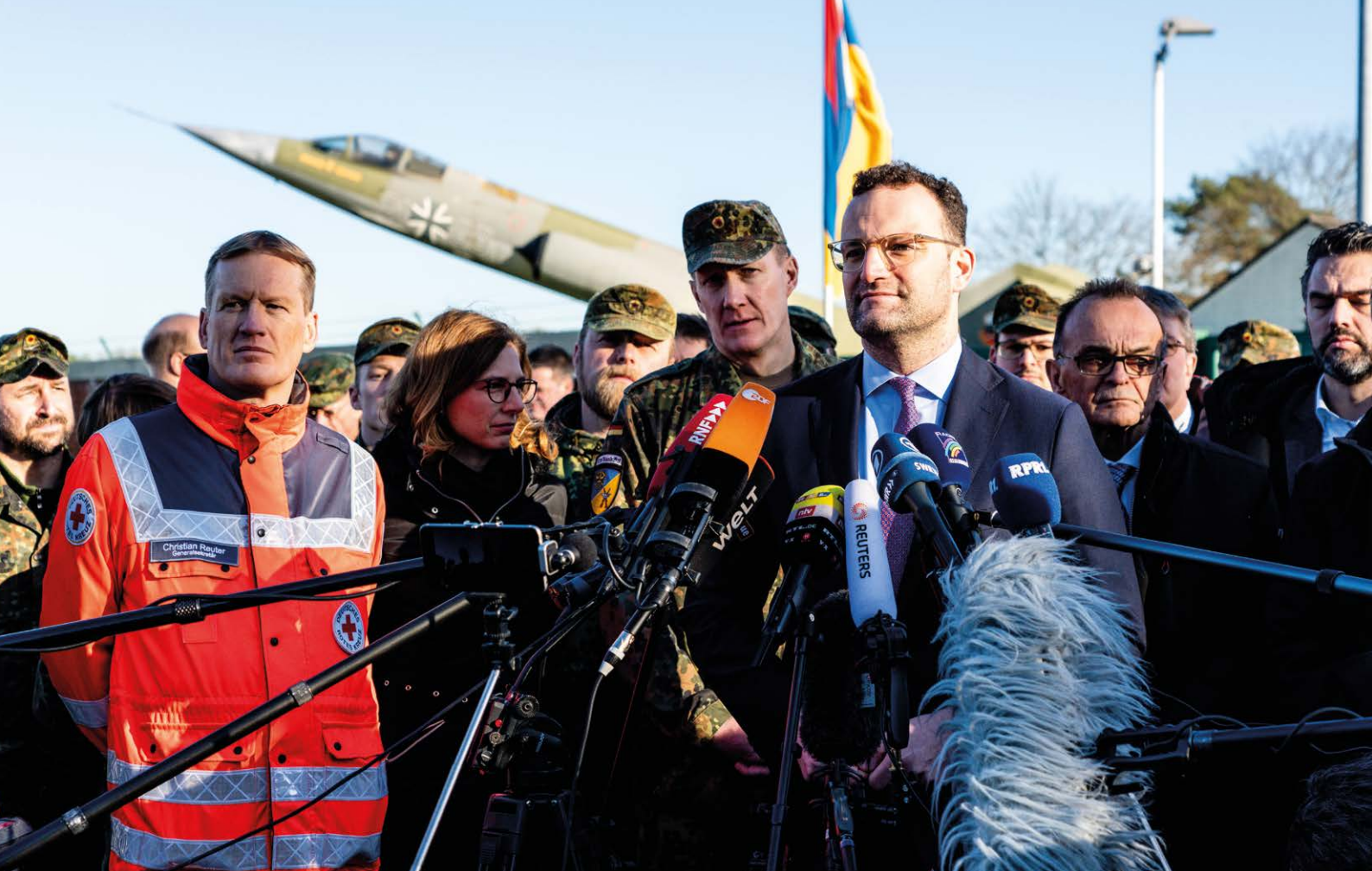
Pressekonferenz des DRK-Generalsekretärs Christian Reuter und des Bundesministers für Gesundheit Jens Spahn in der Südpfalz-Kaserne in Germersheim im Februar 2020