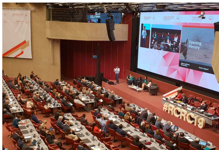
33. Internationale Konferenz des Roten Kreuzes und Roten Halbmondes (Genf 2019)

eigene Programme für das Gemeinwohl, wie etwa in den Bereichen Erziehung, Gesundheit und soziale Wohlfahrt (Art. 3 Abs. 2 Statuten der Bewegung). In Deutschland ist das DRK dementsprechend auch ein anerkannter Spitzenverband der Freien Wohlfahrtspflege und nimmt die Interessen derjenigen wahr, die der Hilfe und Unterstützung bedürfen, um soziale Benachteiligung, Not und menschenunwürdige Situationen zu beseitigen sowie auf die Verbesserung der individuellen, familiären und sozialen Lebensbedingungen hinzuwirken (§ 1 Abs. 4 DRK-Satzung). Im internationalen Bereich ist es Aufgabe der Nationalen Gesellschaften, insbesondere den Opfern von bewaffneten Konflikten, Naturkatastrophen und anderen Notlagen Beistand zu leisten (Art. 3 Abs. 3 Statuten der Bewegung). In Übereinstimmung mit § 2 DRKG nimmt das DRK zudem Aufgaben wahr, die sich für eine Nationale Gesellschaft aus den Genfer Abkommen und ihren Zusatzprotokollen ergeben. Zu diesen Aufgaben zählen somit insbesondere die Unterstützung des Sanitätsdienstes der Bundeswehr im Sinne des Art. 26 des I. Genfer Abkommens, die Verbreitung von Kenntnissen über das humanitäre Völkerrecht sowie die Grundsätze und Ideale der Bewegung, die Wahrnehmung der Aufgaben eines amtlichen Auskunftsbüros nach Art. 122